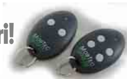
Der praktische Öffner als Schlüsselbund Un pratico telecomando-portachiavi